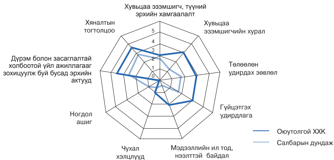
Зураг 1. Оюутолгой ХХК-ийн засаглалын түвшинг төрийн өмчит уул уурхайн компаниудын дундаж үзүүлэлттэй харьцуулсан байдал

Компанийн ерөнхий үнэлгээнээс харахад компанийн үйл ажиллагааг зохицуулах дүрэм болон бусад баримт бичгүүд болон хяналтын тогтолцоо, хувьцаа эзэмшигчдийн хурал, ТУЗ, гүйцэтгэх удирдлага зэрэг үзүүлэлтүүд нь судалгаанд хамрагдсан бусад компанийн ийм төрлийн үзүүлэлтүүдээс илүү өндөр үнэлгээ авсан байна. Үнэлгээний үзүүлэлтүүдийн хэрэгжилтийг тодорхойлох нийт 130 гаруй асуулгаас 40 гаруй хувьд 5 оноо авсан нь бусад компанитай харьцуулахад илүү дээгүүр үнэлгээ юм. Үүнийг Хүснэгт 2-т үзүүлэв.